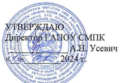
ГРАФИК ПРОМЕЖУТОЧНОЙ АТТЕСТАЦИИ

группы ПД-319 специальность 40.02.02 Правоохранительная деятельность